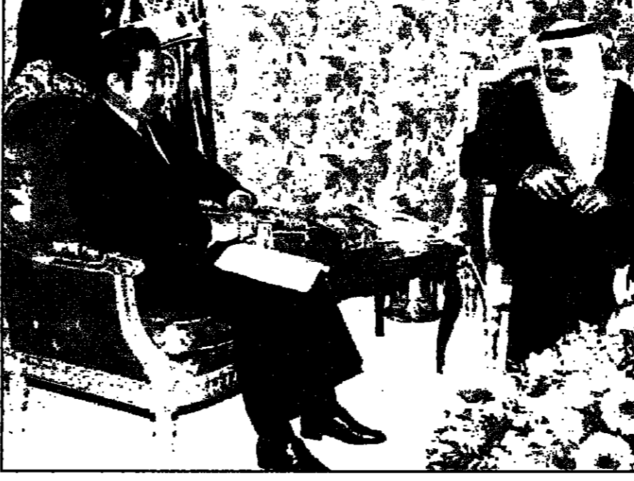
المعامل السعودي للنفط في الرياض مع رئيس الوزراء الياباني يويتو هاشيموتو

الرياض - من سليمان التمر: حثت المملكة العربية السعودية رئيس الوزراء الياباني يويتو هاشيموتو على زيادة مشترياتها من النفط السعودي في وقت الذي تتفاوض فيه طوكيو واليابان على تجديد العقد الذي يربط بين البلدين منذ عام 1966. وقال مسؤولون في الرياض ان اليابان لم تتقدم بتجديد العقد الذي يربط بين البلدين منذ عام 1966. وقال مسؤولون في الرياض ان اليابان لم تتقدم بتجديد العقد الذي يربط بين البلدين منذ عام 1966.